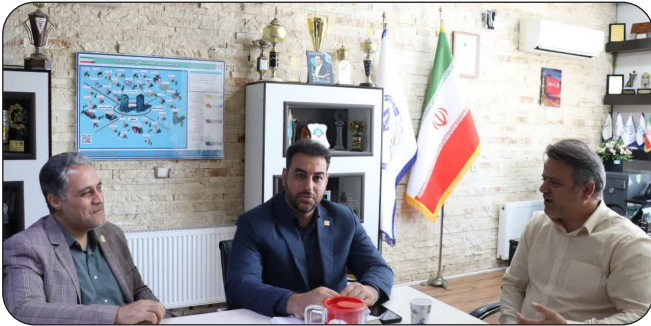
برگزاری دومین جلسه کارگروه عفاف و حجاب سازمان جهاد دانشگاهی کرمانشاه