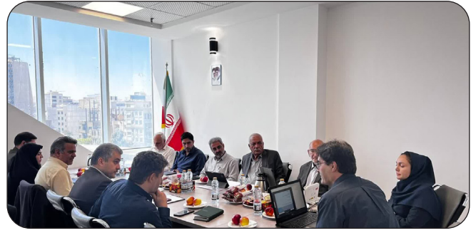
برگزاری پنجمین جلسه شورای فناوری پارک علم و فناوری کرمانشاه