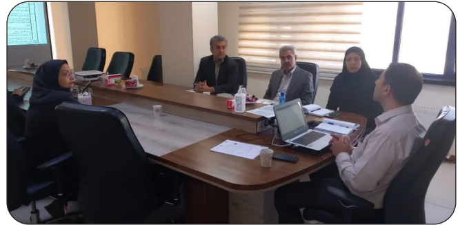
برگزاری پنجمین جلسه شورای پژوهش و فناوری سازمان جهاد دانشگاهی استان کرمانشاه