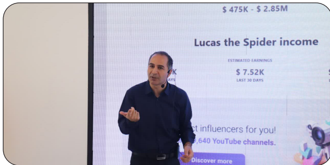
برگزاری اولین دوره بازی سازی در مرکز گییم و انیمیشن پارک علم و فناوری استان کرمانشاه