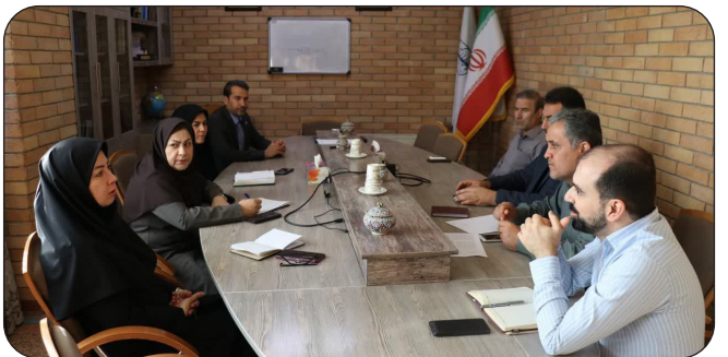
برگزاری بیست و یکمین جلسه شورای آموزش سازمان جهاد دانشگاهی استان کرمانشاه