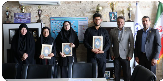
تجلیل از مسئولین دفتر فرهنگی سازمان جهاد دانشگاهی استان کرمانشاه در دانشگاهها