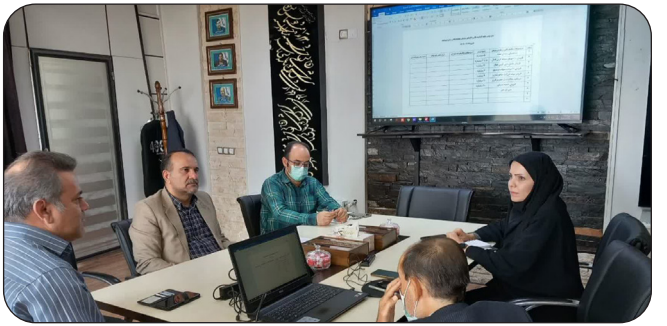
برگزاری چهارمین جلسه شورای سرمایه گذاری و اقتصاد جهاد دانشگاهی سازمان استان کرمانشاه