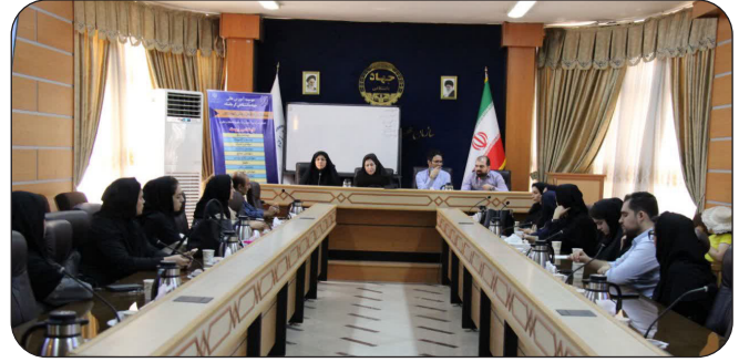
نشست مسئولین موسسه آموزش عالی جهاد دانشگاهی کرمانشاه با مشاوران تحصیلی کانون «قلم چی» و سایر آموزشگاه‌های شهر کرمانشاه