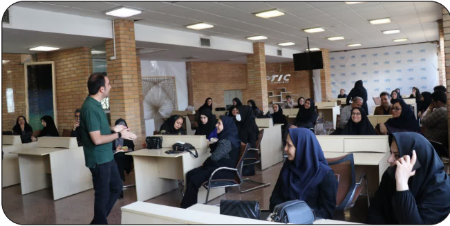
دردستای طرح شهید نوروززاد دبیران اداره کل آموزش و پرورش استان کرمانشاه با طراحی بوم کسب و کار آشنا شدند