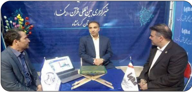
حضور فعال خیرگزاری ایگنا در چهاردهمین نمایشگاه قرآن کرمانشاه