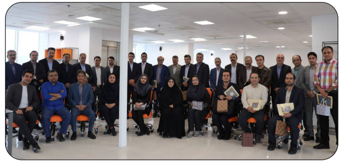
نشست تجلیل از مشاوران پارک علم و فناوری استان کرمانشاه