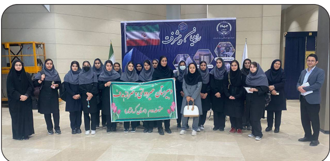
برگزاری اردوی راهیان پیشرفت