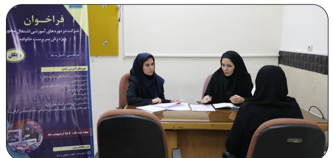
آغاز طرح توانمند سازی بانوان سرپرست خانواده