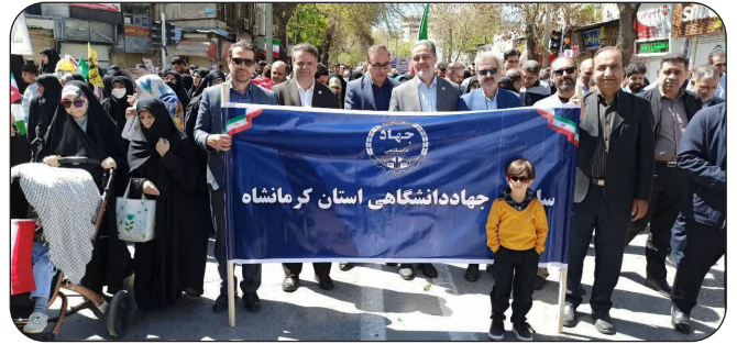
حضور جهادگران جهاد دانشگاهی استان کرمانشاه در راهپیمایی روز قدس