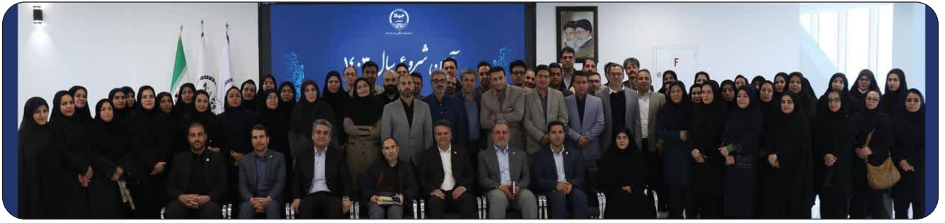
آیین آغاز بکار سال ۱۴۰۳ جهاد دانشگاهی استان کرمانشاه