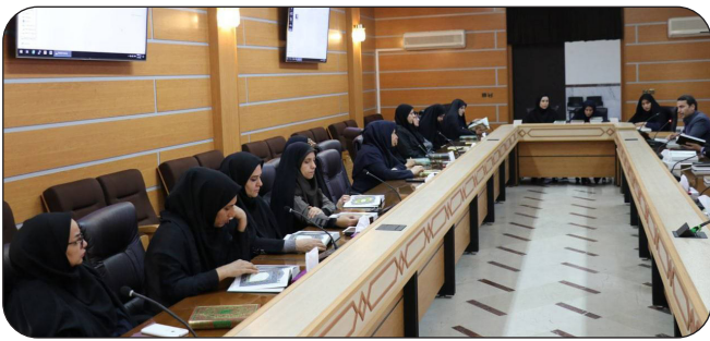
برگزاری محفل پر نور انس با قرآن کریم بدرقه ی ماه مبارک رمضان