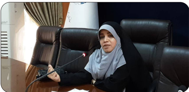
برگزاری نشست سبک زندگی قرآنی در سازمان جهاد دانشگاهی کرمانشاه