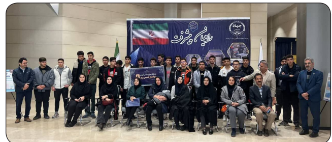
بازدید دانش آموزان «راهبان پیشرفت» از سازمان جهاد دانشگاهی استان کرمانشاه