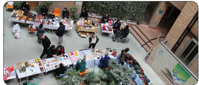
برپایی نمایشگاه صنایع دستی و محصولات خانگی در سازمان جهاد دانشگاهی کرمانشاه