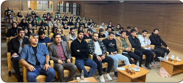
کارگاه تخصصی «کارخانه کسب و کار» در کرمانشاه برگزار شد