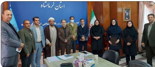
جهادگر کرمانشاهی پژوهشگر برتر حوزه تعاون، کار و رفاه اجتماعی شد