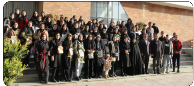
برگزاری جشن روز دانشجو با حضور پرشور دانشجویان در موسسه آموزش عالی جهاد دانشگاهی