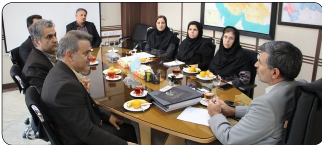
نشست رییس سازمان جهاد دانشگاهی کرمانشاه با رییس سازمان مدیریت و برنامه ریزی استان