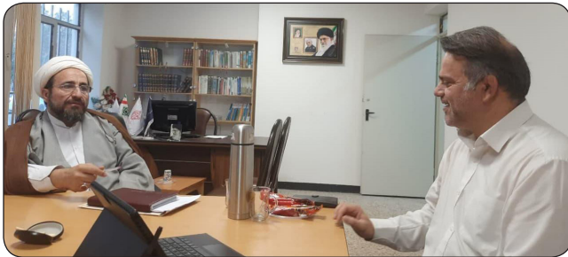
آغاز فعالیت های مشترک دفتر خلاقیت فرهنگی با همکاری نهاد نمایندگی مقام معظم رهبری و سازمان جهاد دانشگاهی استان