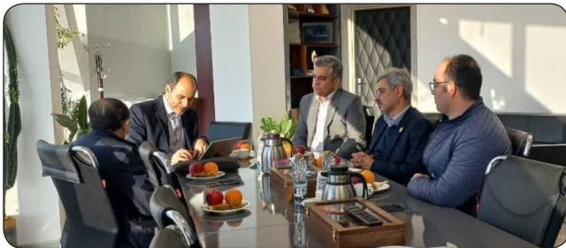
نشست رییس مرکز آمار و فناوری اطلاعات قوه قضاییه با رییس و مدیران پارک علم و فناوری استان